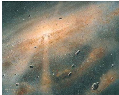
Pintura por William K. Hartmann que muestra una etapa temprana de formación del Sol y los planetas.

Resultados de MESSENGER sugieren que materiales que se originaron a distintas distancias del Sol se mezclaron en gran medida para formar los planetas.