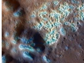
Imagen con colores resaltados de MESSENGER de una porción de la cuenca de impacto Raditladi en Mercurio. La regiones brillantes y azuladas se componen de depresiones irregulares (cavidades). Estas muescas pueden estar activamente en formación en el presente.