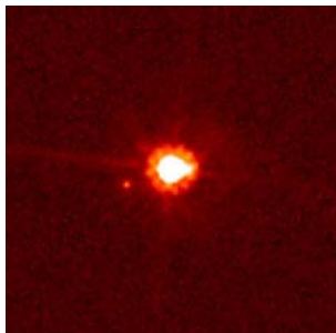
Imagen del Telescopio Espacial Hubble de Eris y su luna Dysnomia.