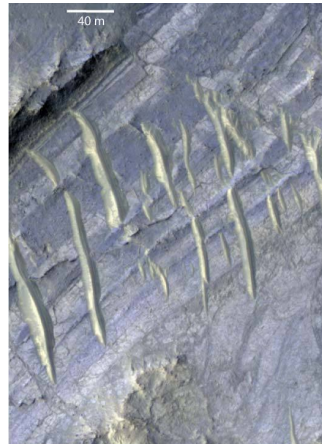
Imagen del interior de un cráter marciano de la nave Mars Reconnaissance Orbiter de la NASA. La imagen muestra en colores falsos regiones elevadas que contienen carbonatos.