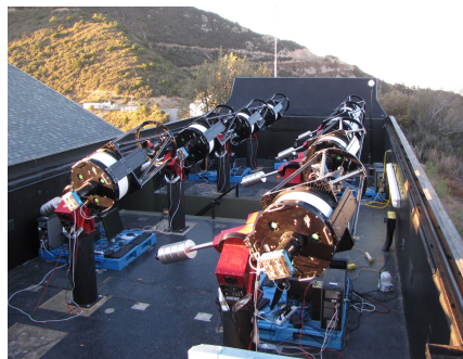
Como parte del proyecto M-Planet Earth, ocho telescopios de 16" monitorean unos cuantos miles de estrellas más frías que el Sol, buscando planetas que transitan. Configuraciones de equipo similares pronto podrán tener la capacidad de detectar desde la superficie de nuestro planeta a otros planetas del tamaño de la Tierra.