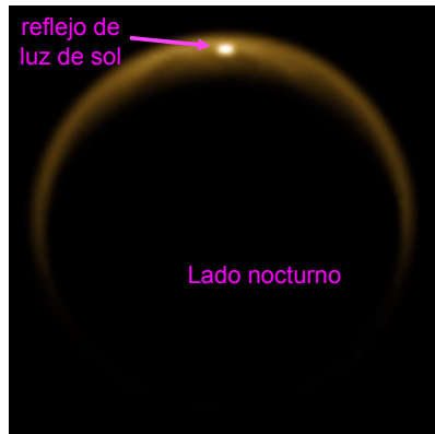
Imagen infrarroja de la luna de Saturno Titán tomada por la nave Cassini sobre el lado nocturno del planeta. El área brillante en la región polar del norte iluminada por el sol había ya sido anticipada, y resulta de la luz solar reflejada por la superficie de un lago de metano.