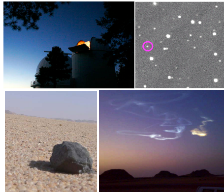
En el sentido de las agujas del reloj de arriba a la izquierda: Telescopio de Catalina Sky Survey donde TC3 fue descubierto. Imagen de detección de 2008 TC3. Imagen de teléfono celular de los rastros luminosos dejados en la atmósfera cuando TC3 se desintegró. Meteorito de TC3 en el Desierto de Nubia en el norte del Sudán.