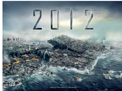
Cartel de la película '2012', estrenada en noviembre del 2009. La película presenta actividad geológica global y desastres naturales desencadenados por el Sol.