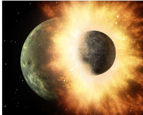
Interpretación artística de dos planetas sufriendo una colisión cataclísmica. Colisiones como estas suceden en sistemas planetarios, pero son altamente improbables después de que el sistema ha completado su formación.