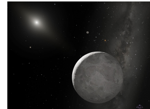
Interpretación artística del planeta enano Eris. De NASA / ESA / A. Schaller